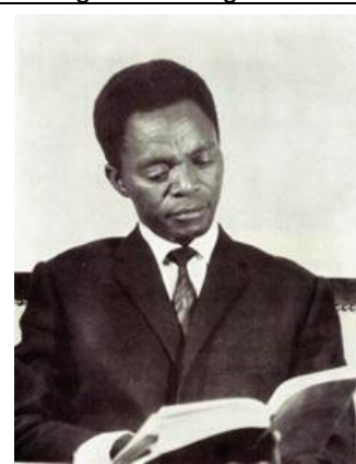
Stichter van Parmehutu en later eerste president, G. Kayibanda