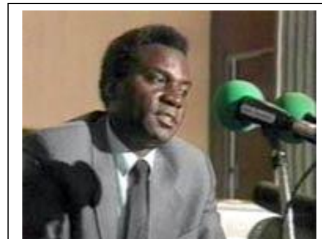
De tweede president, Juvénal Habyarimana