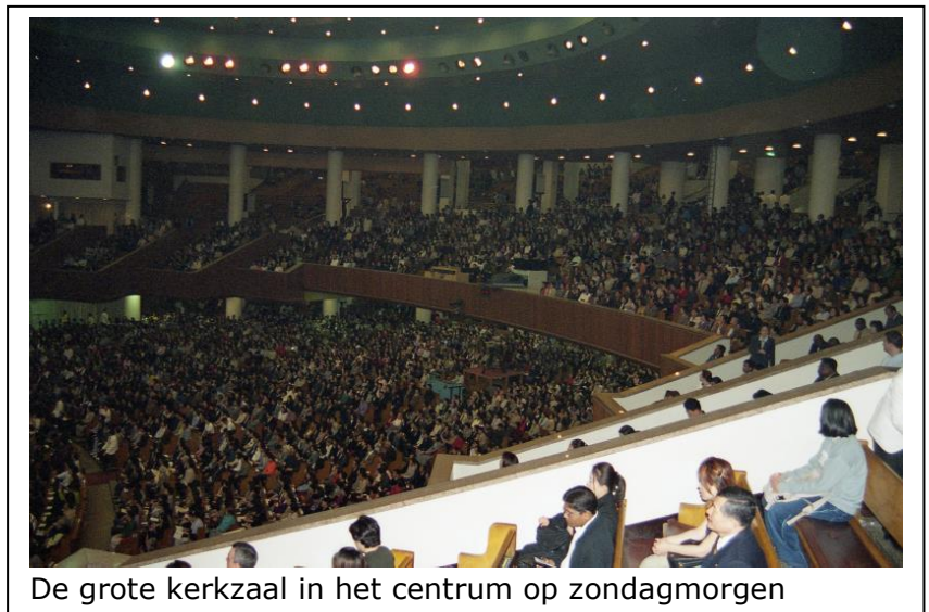
De grote kerkzaal in het centrum op zondagmorgen