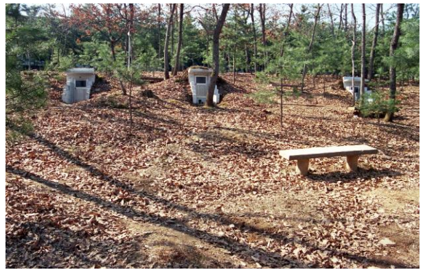
De 'gebedscellen', waar je je kan terugtrekken

geheven, telkens vooroverbuigend. Niets wanordelijks, niets extreems, maar wel ferm en vurig, zonder zich te generen voor elkaar. Ook in de gebedsgrotjes (heel kleine kamertjes half onder de grond) hoorde je mensen roepen of zingen. Boven op de berg hoorde je zelfs om 2-3 uur 's nachts nog groepjes tot God roepen. Op zekere nacht, terwijl het buiten lichtjes vroomde, hoorde ik in een gebedsgrotje een vrouw bidden: ik verstond er geen woord van, maar het kwam bij mij over alsof ze het tot God uitriep en haar keel schor smeekte om een gestorven kind weer tot leven te wekken. Nog nooit had ik iemand zo horen bidden.