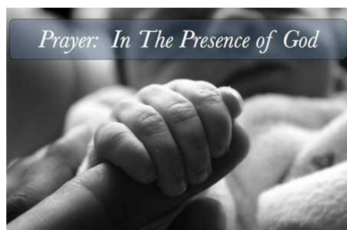
Prayer: In The Presence of God

“Zal God dan niet zeker recht verschaffen aan zijn uitverkorenen die dag en nacht tot hem roepen? Of laat hij hen wachten?” (Lukas 18:7)